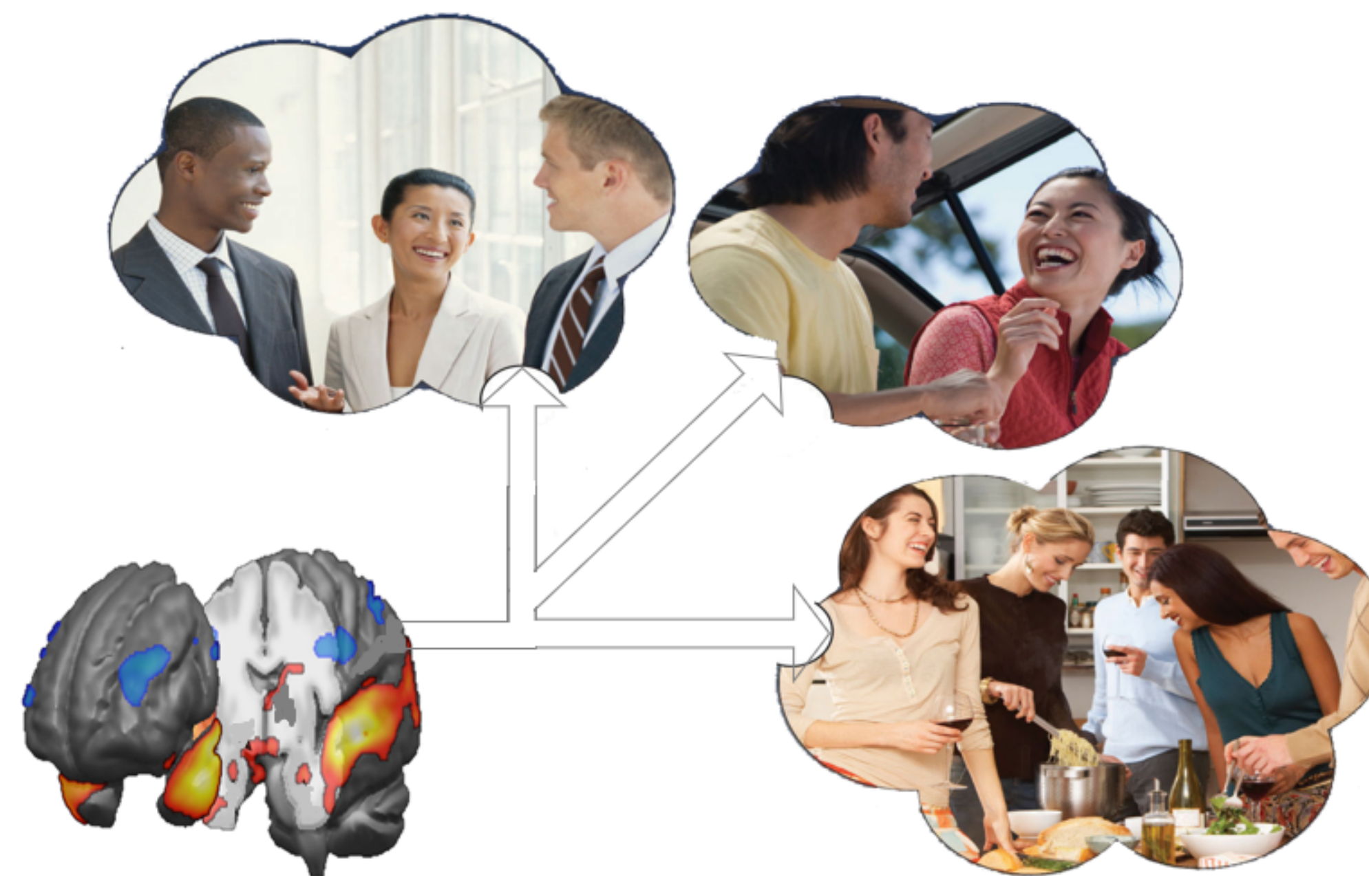
Figure 1: L'activité cérébrale au cours des interactions sociales.

L'intelligence artificielle connaît depuis quelques décennies une croissance rapide en termes de recherche et développement dans différents domaines, en particulier dans les neurosciences. Nous nous intéressons dans ce projet à expliquer et à décrire le fonctionnement du cerveau humain lors des interactions Humain-Humain (IHH) et Humain-Robot (IHR). Dans une interaction sociale (verbale ou non verbale), certaines régions du cerveau sont activées selon le contexte de l'interaction, comme illustré dans la Figure 1.